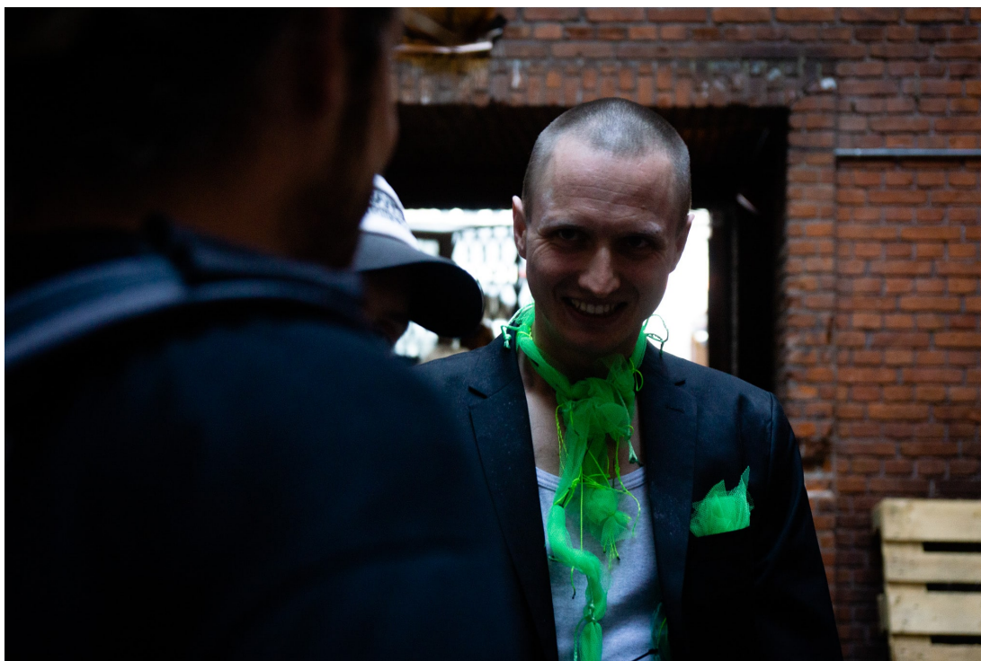
Afslag, MAGMA Teater på Basement.

“Vil du sige, at du har magt?”, spørger han, da min arbejdsidentitet som anmelder er klarlagt. Jo, det giver da en vis magt, må jeg indrømme, og indkasserer et stempel på armen. Knap så magtfuldt symbol som dem, der fik en stjerne på brystet.