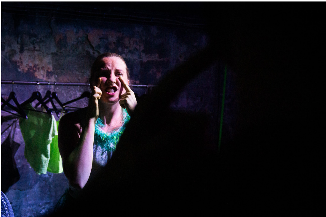
Afslag. MAGMA Teater på Basement.

Nedenunder er det den irrationelle afmagt, der udfolder sig. Én kaster sig rundt i voldsomme bevægelser og søger at få os til at give hende komplimenter i form af små perler. En anden rabler og tæsker løs på skumplader, før hun synker ned i vegeerende omgang med en flødeskum på spray. En tredje forsøger ligesom båndsamtalet at overkomme afslaget med spørgsmål og selvkritik, som hun skribler ned og hænger til tørre.