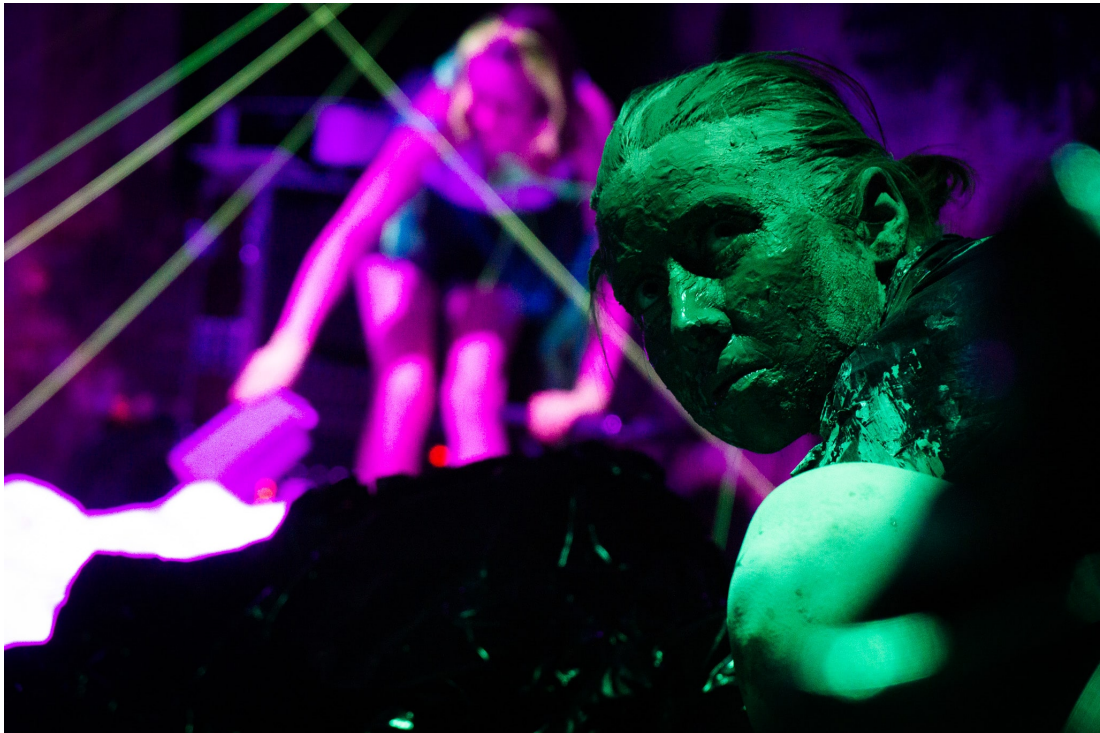
Afslag. MAGMA Teater på Basement.